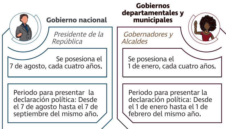
Tabla 1. Niveles y tiempos de declaraciones políticas