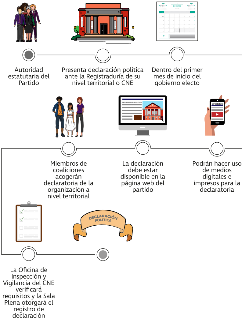
Figura 1. Procedimiento para presentar la declaración política