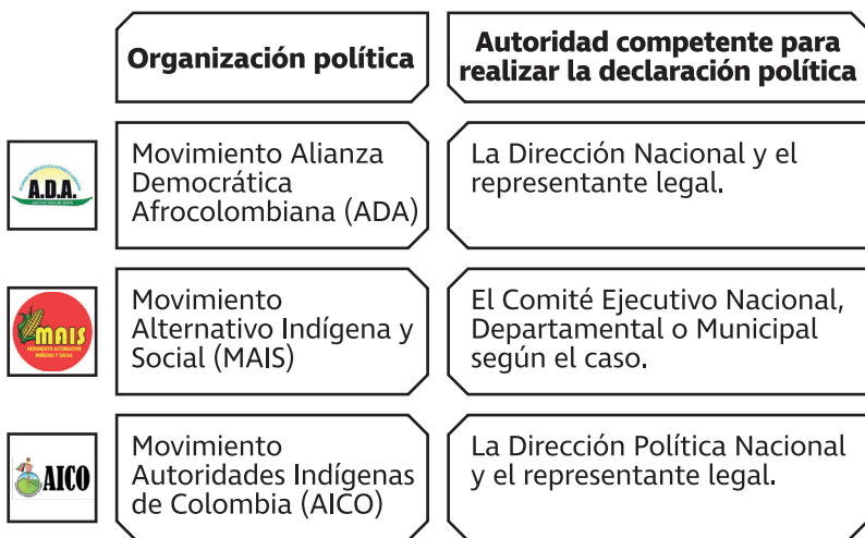
Tabla 2. Órganos partidarios competentes para realizar declaraciones políticas 2

De acuerdo con los estatutos de las organizaciones políticas registrados ante el CNE, estos son los órganos e instancias competentes para efectuar las declaraciones políticas en el nivel nacional y en el territorial: