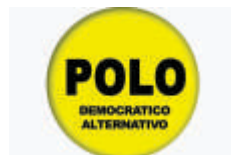
Partido Polo Democrático Alternativo